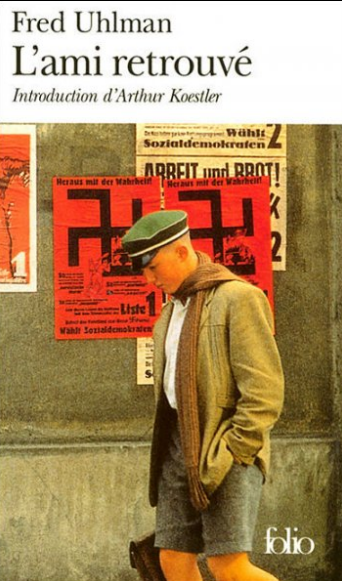
1 ère de couverture du roman de 1971, réédition