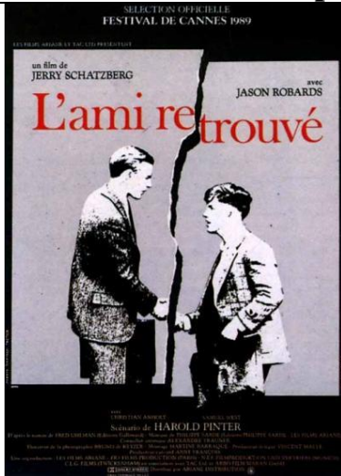
Affiche de cinéma, 1989

- Quelles informations complémentaires amènent ces affiches successives ?