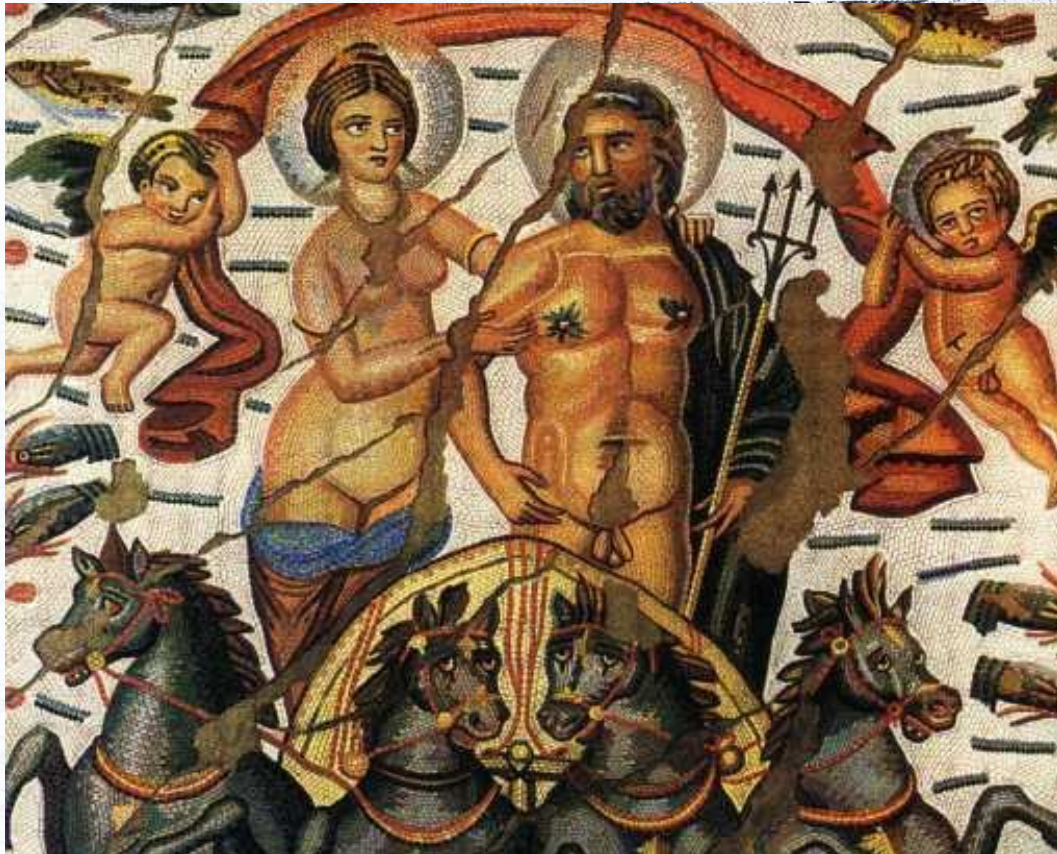
Mosaïque trouvée à Cirta (Algérie), conservée à Paris (musée du Louvre)